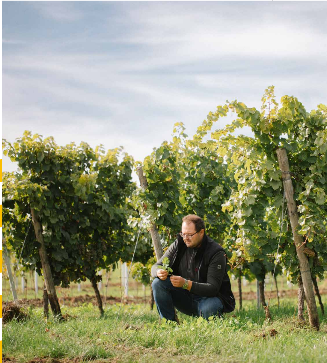
Simon ist tief in die Materie eingetaucht und arbeitet mit individuellen Einsaaten, dem eigenen Kompost und natürlich viel ökologischem Handwerk.